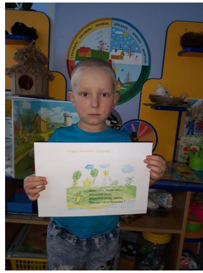
Раздача памяток родителям «Лесные пожары»