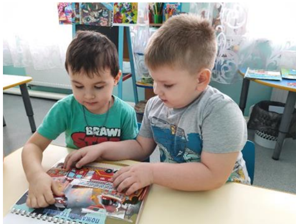
Консультации для родителей и памятки «Пожарная безопасность».