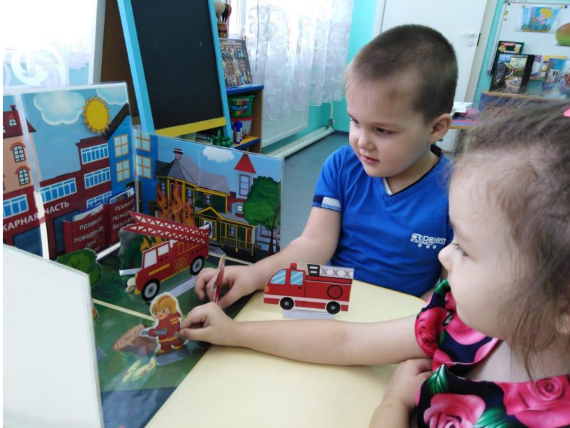
Рассматривание альбомов «Огонь – враг», альбом на липучках «Пожарная безопасность»