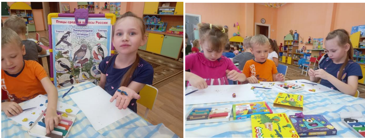
Оформлена выставка рисунков: «Синичка наш гость»