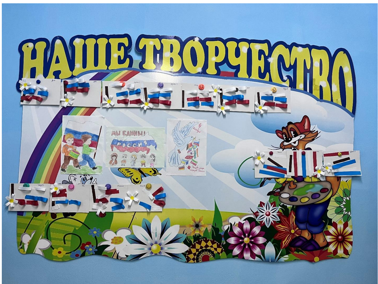
Выставка рисунков: «День народного единства».