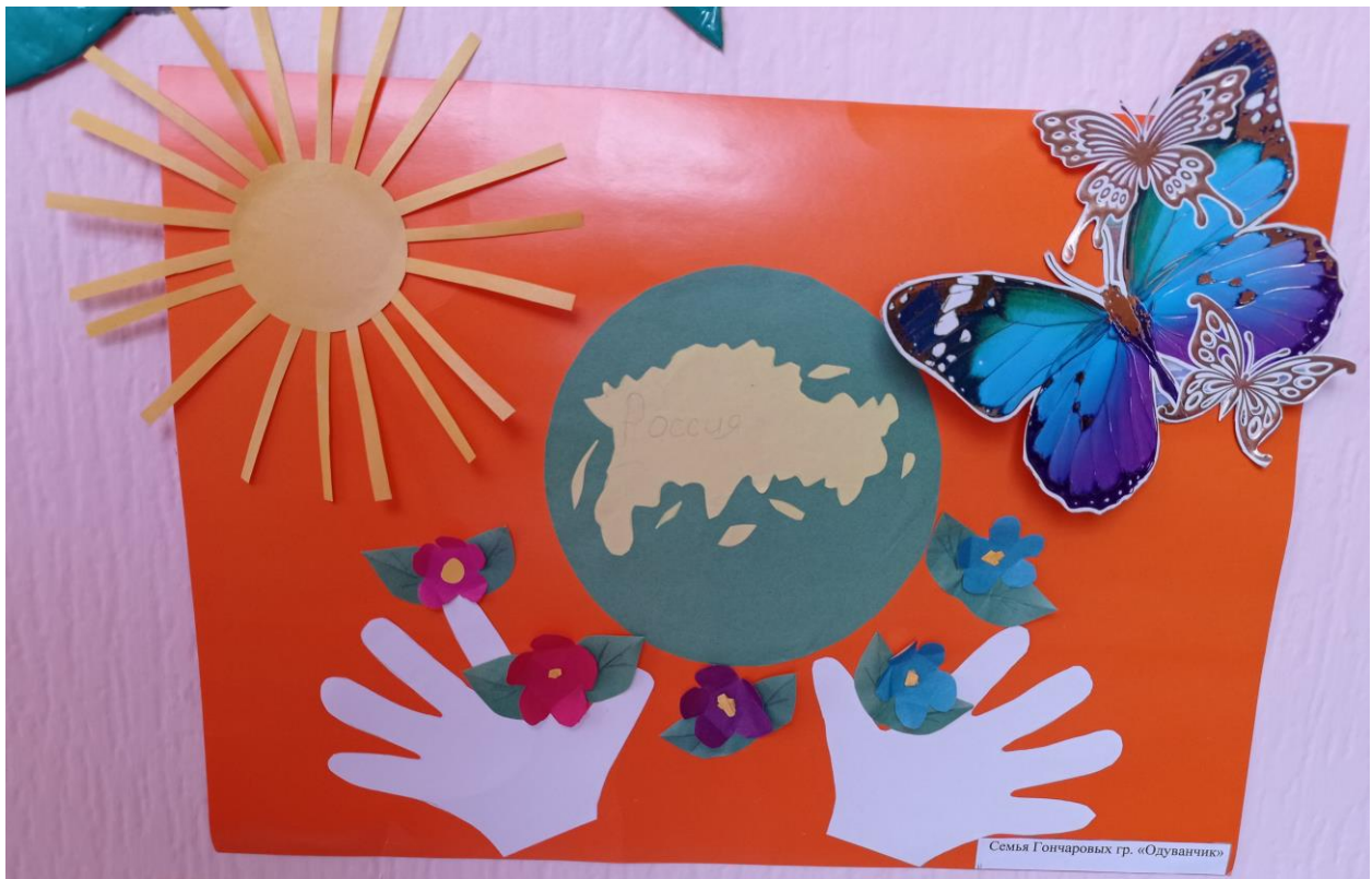
Семья Гончаровых гр. «Одуванчик»