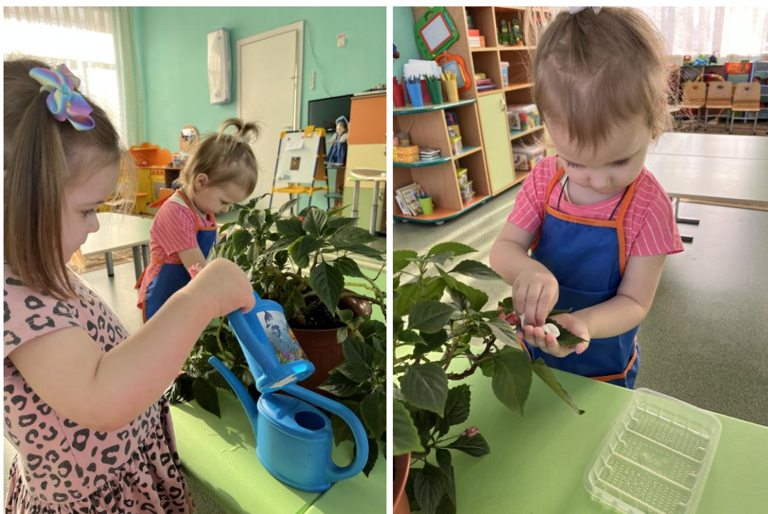
Вторая младшая группа «Василёк».

Ребята из второй младшей группы «Василёк» узнали, что из любого мусора можно сделать полезные и красивые вещи своими руками. И изготовили красивые нарциссы из бросового материала.