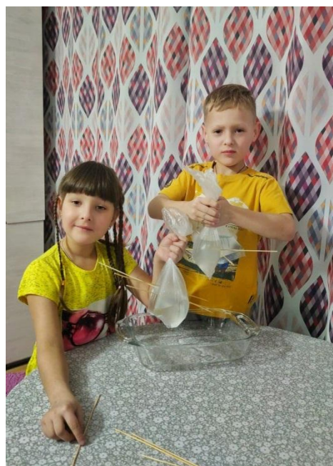
Эксперимент: «Кипение без огня»