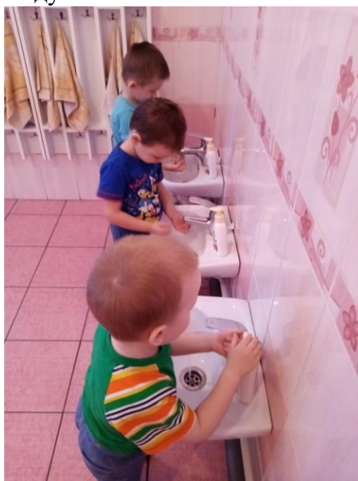
Изготовление постеров «Предметы личной гигиены», «Чистота залог здоровья», «Чтобы не было кариеса».