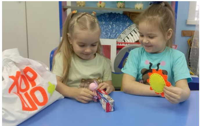
Совместное творчество родителей и детей «Гигиена и Здоровье»