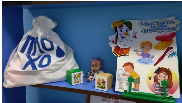
Выставка «Личная гигиена»