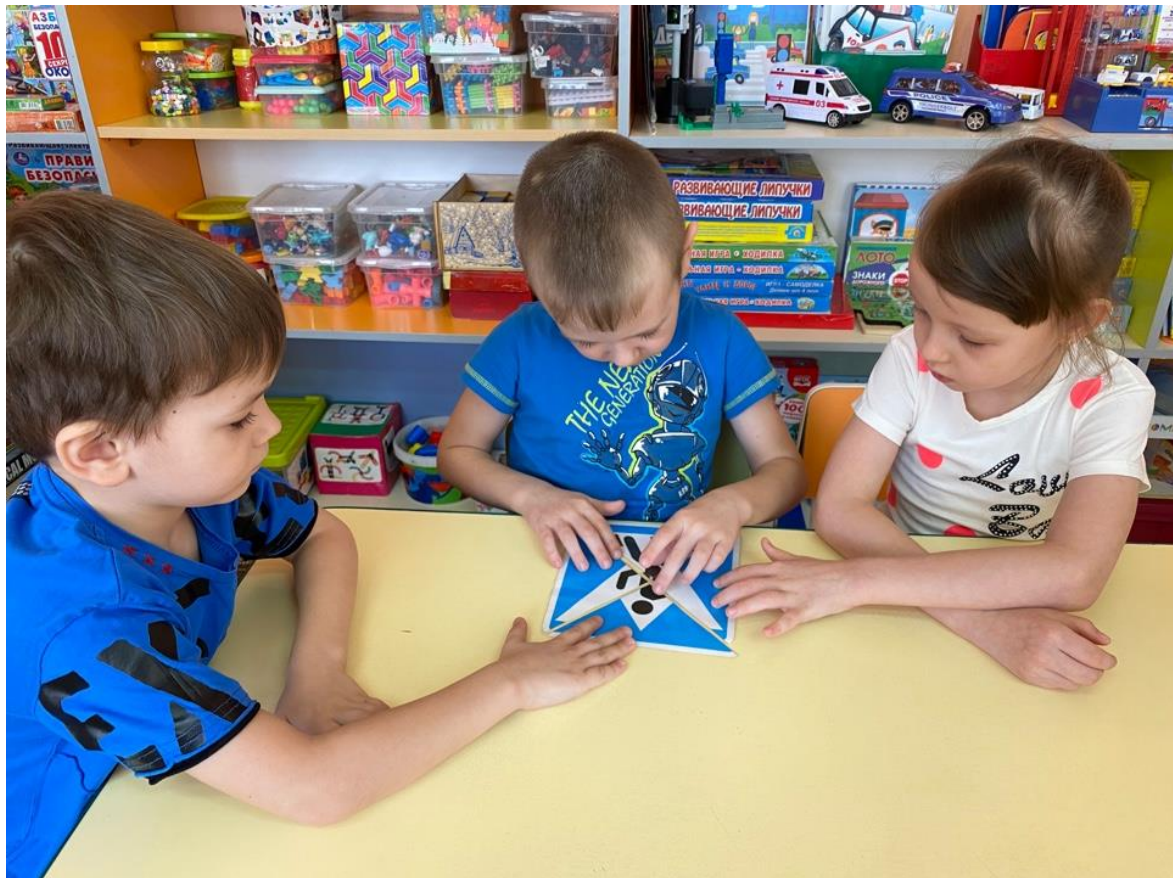
29.03.2024г Конструирование из бумаги «Светофор»