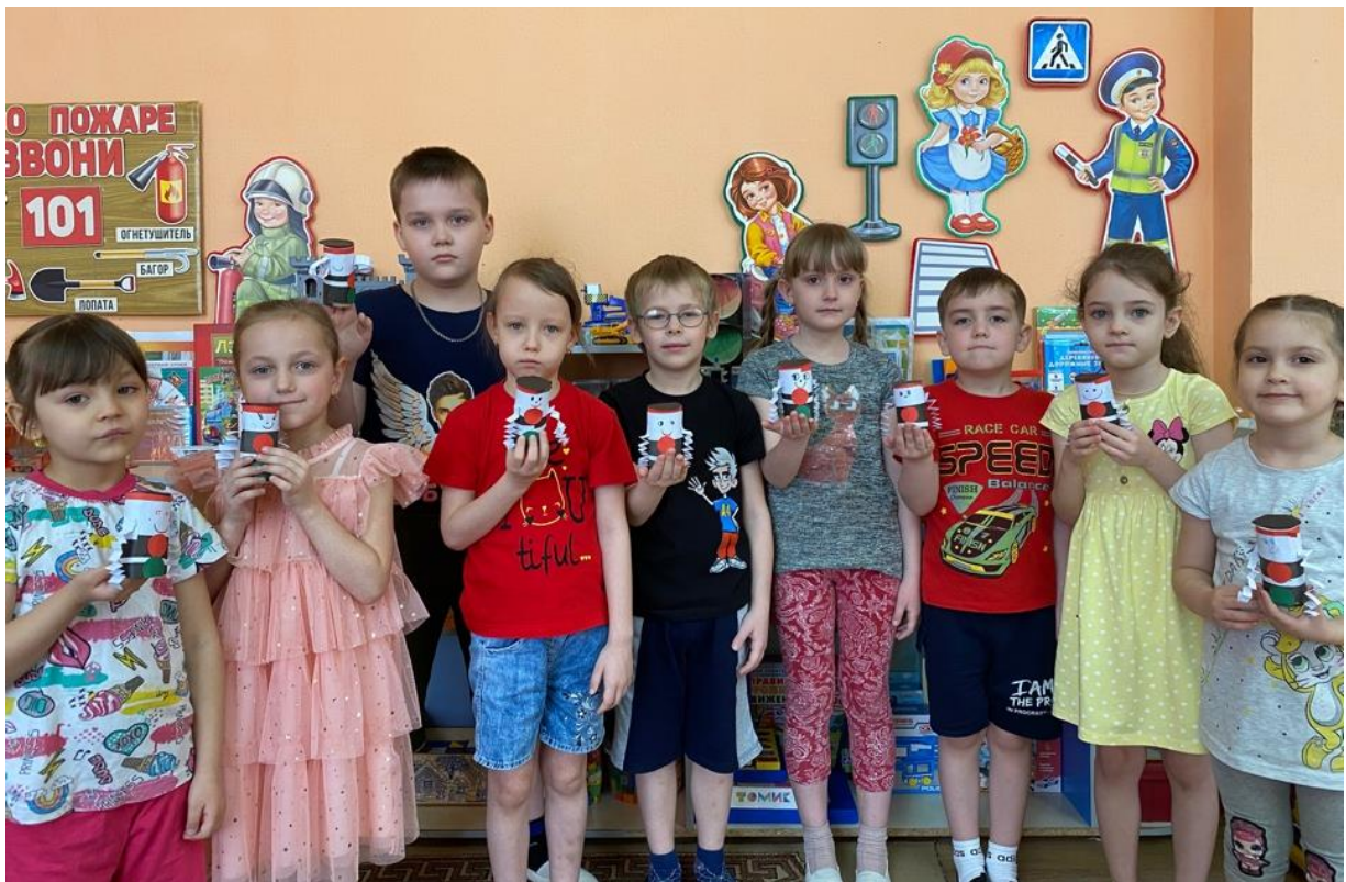
02.04.2024г Рисование рисунков «Безопасные дороги глазами ребенка»