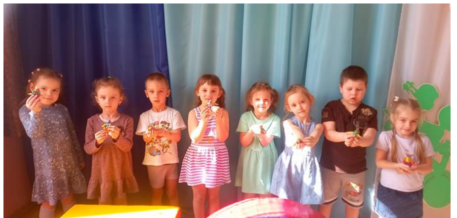
Аппликация «Ракета на старт»