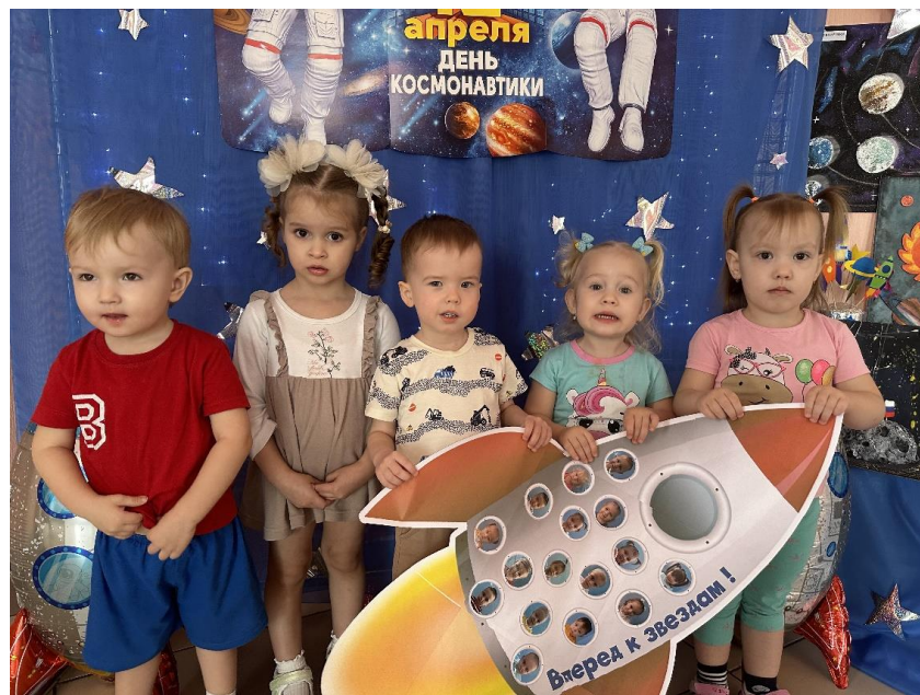
Экскурсия на выставку «Космос – это интересно»