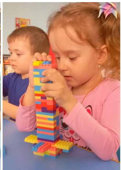
Мероприятия в подготовительной группе «Ромашка»