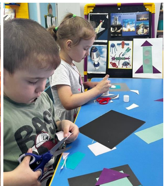
Конструирование «Ракета моей мечты».